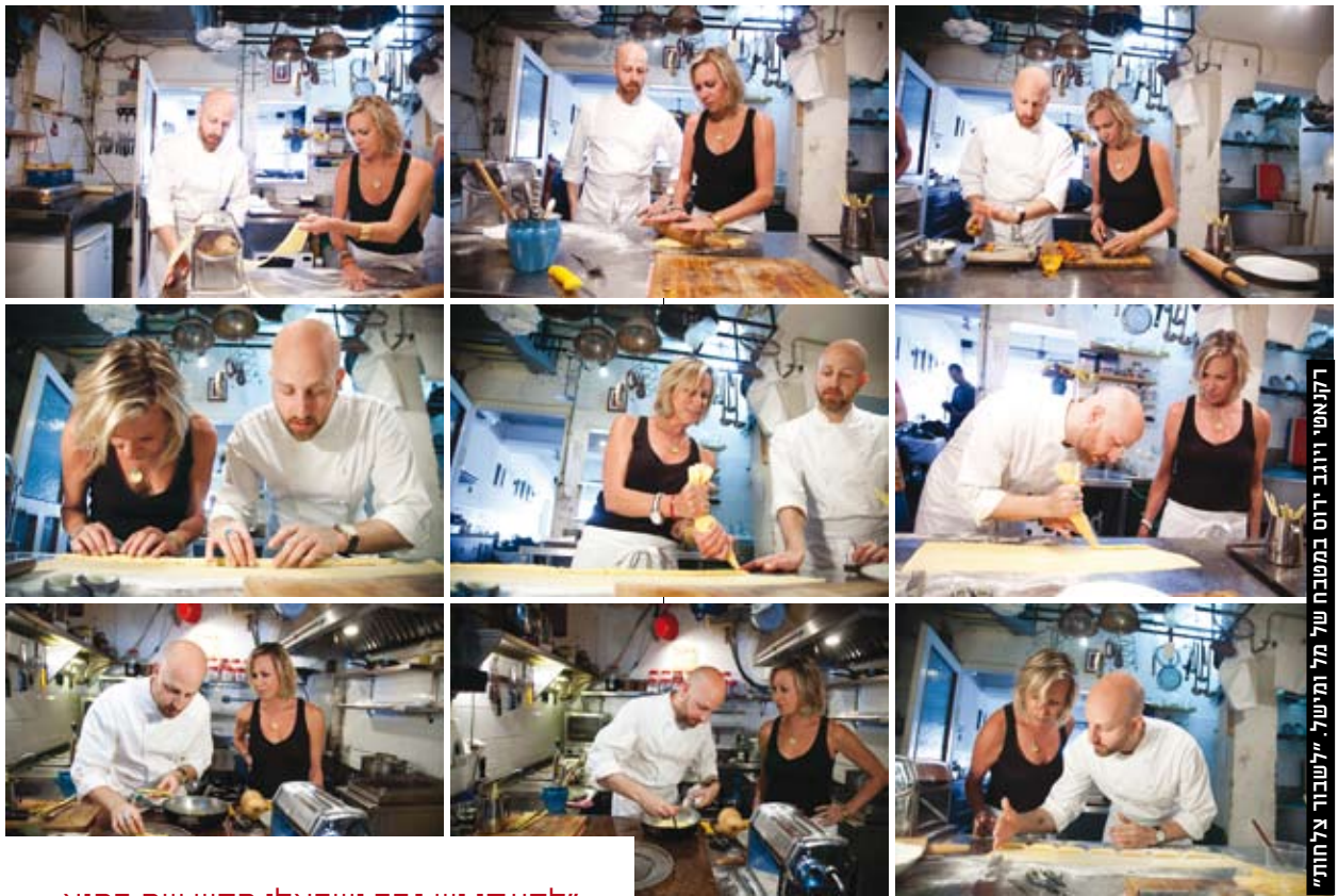
רקנאטי ויונג'ירוס במטבח של "לשבור צלחות"

"לדעתי יש גבר ישראלי חדש שם בחוץ. הגבר שאני רוצה צריך לדעת מיהו ומה הוא אוהב ולאהוב אשה שיודעת מה היא אוהבת ולא מפחדת לומר מה היא אוהבת. מראה חשוב לי אבל יותר חשוב לי המבט בעיניים. אין לי אהבה עכשיו. אני פתוחה לאהבה ומאמינה בה"